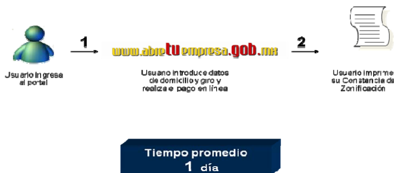
Figura 2. Proceso para la obtención de la Constancia de Zonificación y/o Dictamen de Uso de Suelo con el portal abretuempresa.gob.mx

El portal ha tenido un gran impacto en la simplificación de este trámite, ya que el usuario no requiere trasladarse para realizarlo. Su uso es sencillo y accesible y cuenta con la información no solo del trámite en línea, sino toda la necesaria para completar los trámites para instalar un negocio.