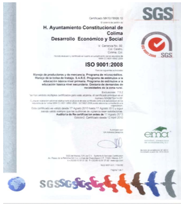
Figura 6. Certificación ISO9001:2008 del SARE

Finalmente, cabe mencionar que el municipio contempla la instalación de una sala de internet para acercar todas estas tecnologías de información a la ciudadanía y facilitar la realización de trámites en línea de los tres órdenes de gobierno.