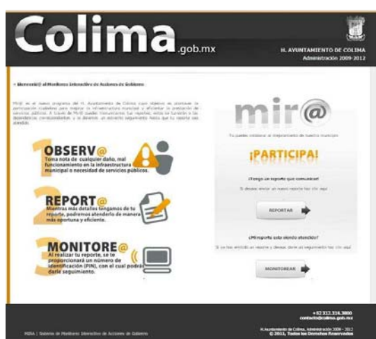
Figura 5. Sistema MIR@

En cuanto a indicadores, el CMN cuenta con un buzón de quejas, sugerencias y felicitaciones, ubicado en un lugar estratégico para que el ciudadano haga uso de este medio de comunicación. Sumado a esto se aplican encuestas de satisfacción por personal de áreas ajenas a la analizada. Un logro importante del municipio es la implementación del sistema Monitoreo Interactivo de Acciones de Gobierno (Mir@), cuyo objetivo es promover la participación ciudadana para mejorar la infraestructura municipal y hacer más eficiente la prestación de servicios públicos. A través de esta herramienta, el ciudadano comunica reportes que son turnados a las dependencias correspondientes para su seguimiento.