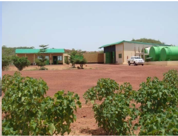
Usine de Koulikoro au MALI