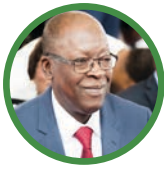
Abdoulaye BIO TCHANÉ Ministre d'État, Chargé du Plan et du Développement du Bénin