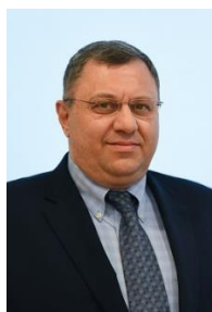
Г-н Нерсес Ерицян

Нерсес Ерицян — заместитель председателя Центрального банка Армении с 2010 года. Ранее занимал посты министр экономики Армении (2008–2010), министра торговли и экономического развития Армении (2007–2008), а также советника председателя Центрального банка Армении. Представлял Армению в международных финансовых институтах, таких как МВФ, ЕБРР, Всемирный банк и Азиатский банк развития (в последнем возглавлял отдел по работе с Арменией).