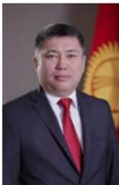
Г-н Алмаз Сыдыков

Член Правления Национального банка Кыргызской Республики.