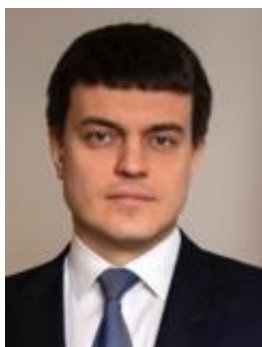
Г-н Михаил Михайлович Котюков

Михаил Михайлович Котюков — заместитель министра финансов Российской Федерации, в должности с 2020 года.