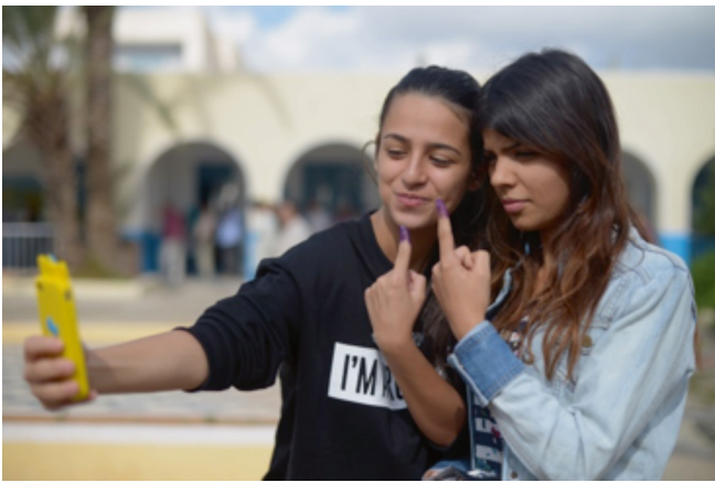
Des jeunes femmes se prennent en photo pendant les élections en Tunisie (Hamideddine Bouali, 2014).

L'IOB a étudié la contribution néerlandaise à la promotion de la transition démocratique dans le monde arabe entre 2009 et 2013, soit pendant les deux années précédant la vague de protestations et les deux années qui l'ont suivie. Les Pays-Bas estimaient que les chances de démocratisation et de développement de l'état de droit méritaient d'être soutenues et que cet engagement servirait au final leurs intérêts sur le plan commercial et énergétique, ainsi qu'en matière de sécurité et de lutte contre l'immigration clandestine.