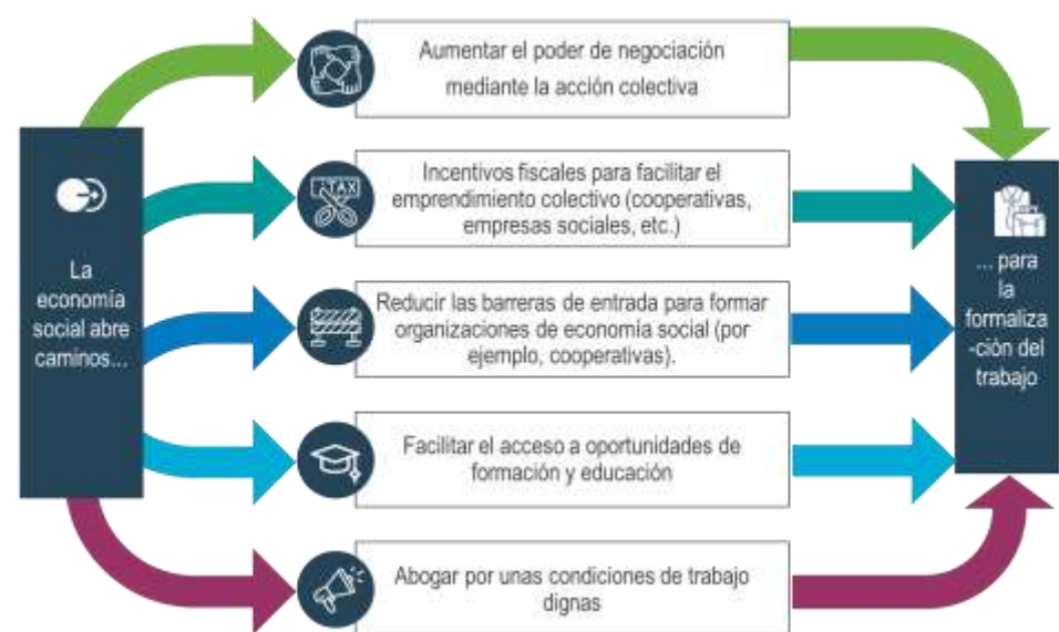
Figura 2. Formas en que la economía social contribuye a reducir la informalidad